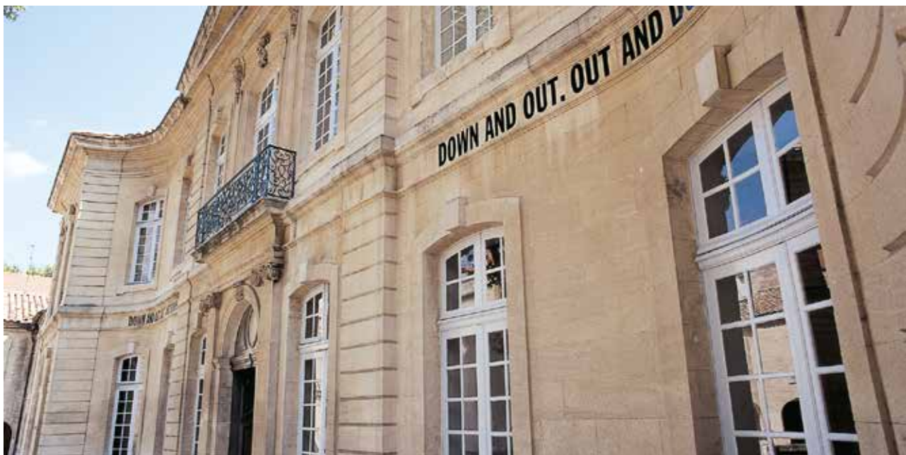
Lawrence Weiner DOWN AND OUT. AND OUT AND DOWN. AND DOWN AND OUT. AND OUT AND DOWN, 1971

Une exposition composée d'une sélection régulièrement renouvelée d'œuvres du fonds est présentée en permanence dans l'Hôtel de Caumont, avec des focus consacrés à certains mouvements ou à certains artistes particulièrement bien représentés dans la collection, tandis que l'Hôtel de Montfaucon accueille les expositions temporaires selon deux cycles annuels.