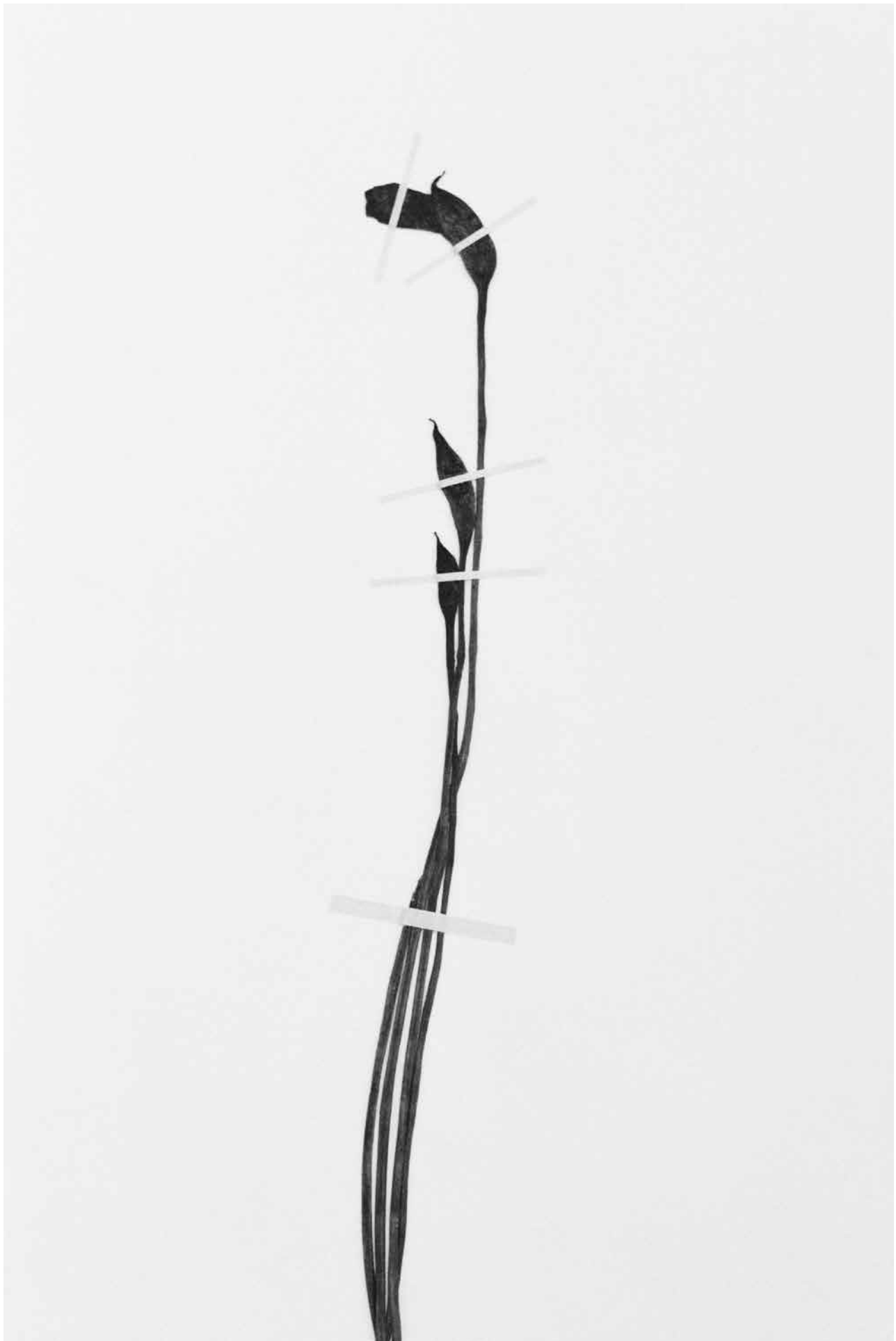
Victoire Thierrée , Aeginetia indica , 2023, tirage gélatino-argentique © Victoire Thierrée / Adagp 2025