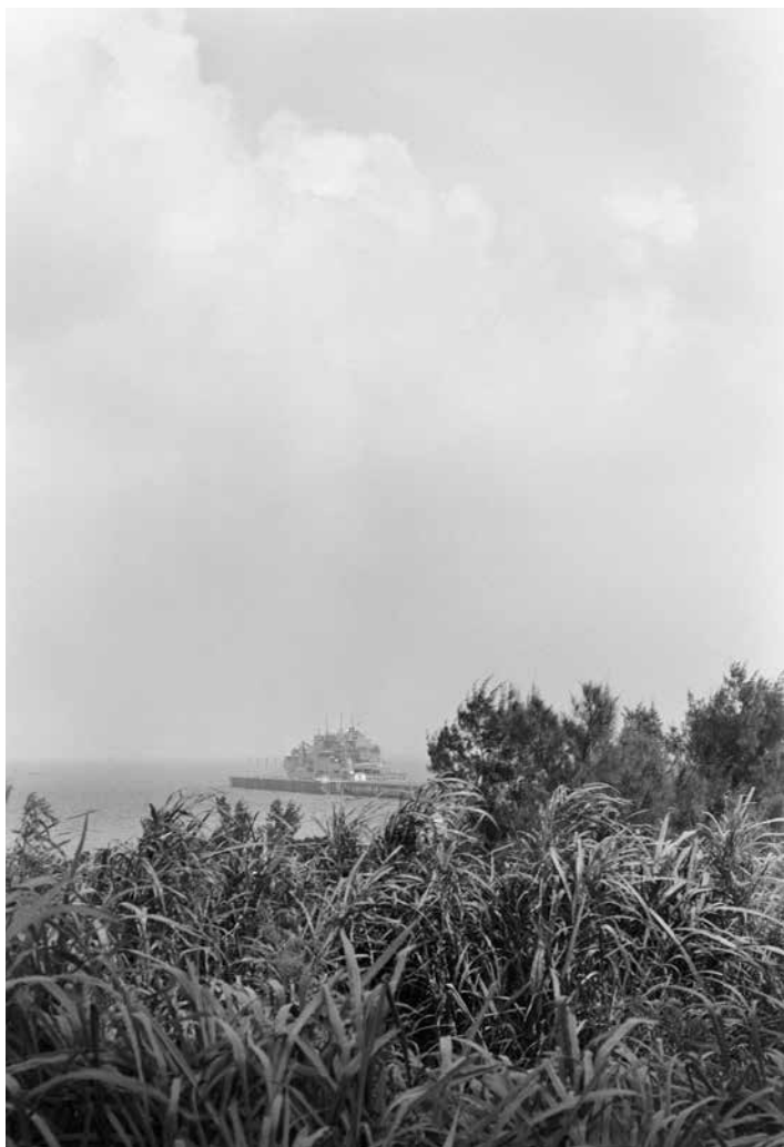
Victoire Thierrée , Camp Schwab #4 , 2019, tirage gélatino-argentique © Victoire Thierrée / Adagp 2025