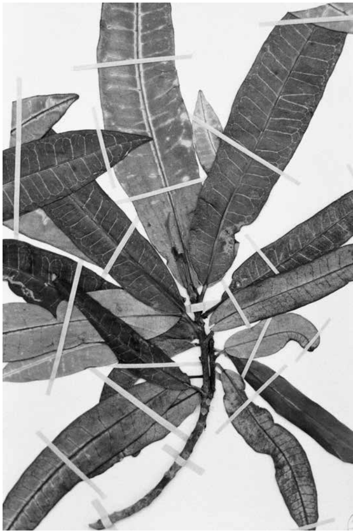
Victoire Thierrée , Codiaeum variegatum , 2023, tirage gélatino-argentique