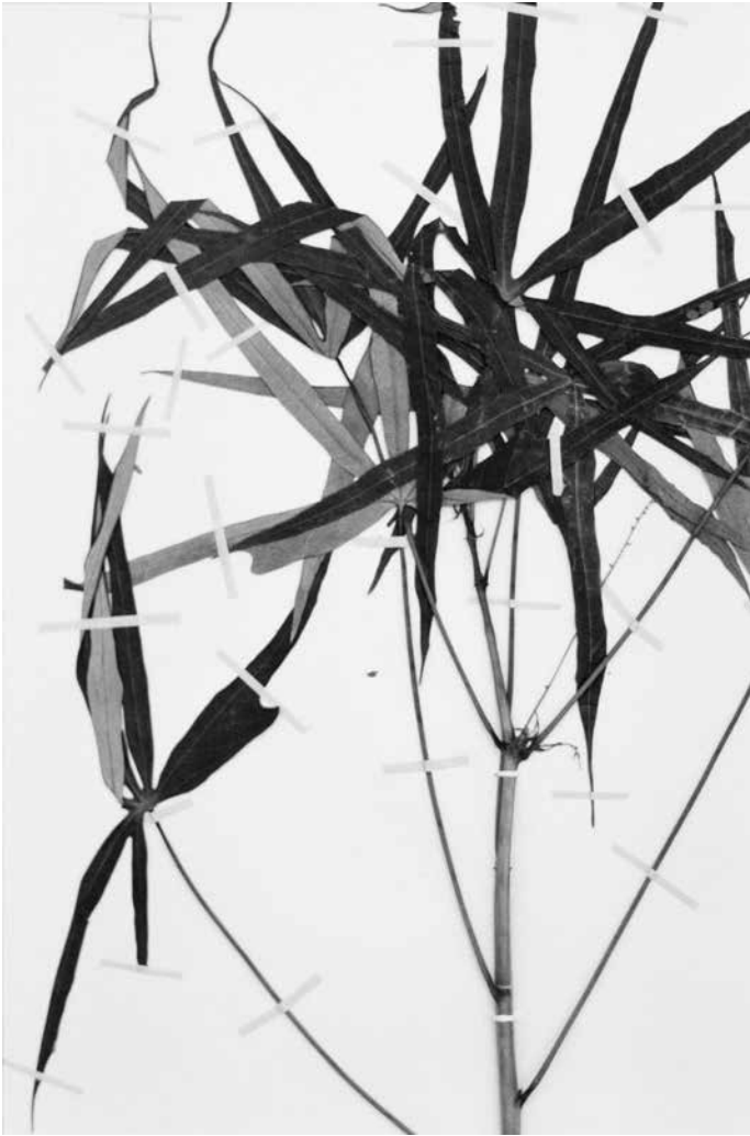
Victoire Thierrée , Manihot esculenta Crantz #1, 2023 tirage gélatino-argentique