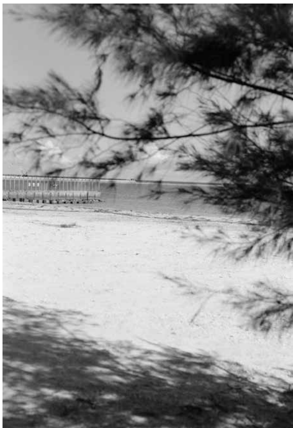
Victoire Thierrée , Henoko #29 , tirage gélatino-argentique © Victoire Thierrée / Adagp 2025