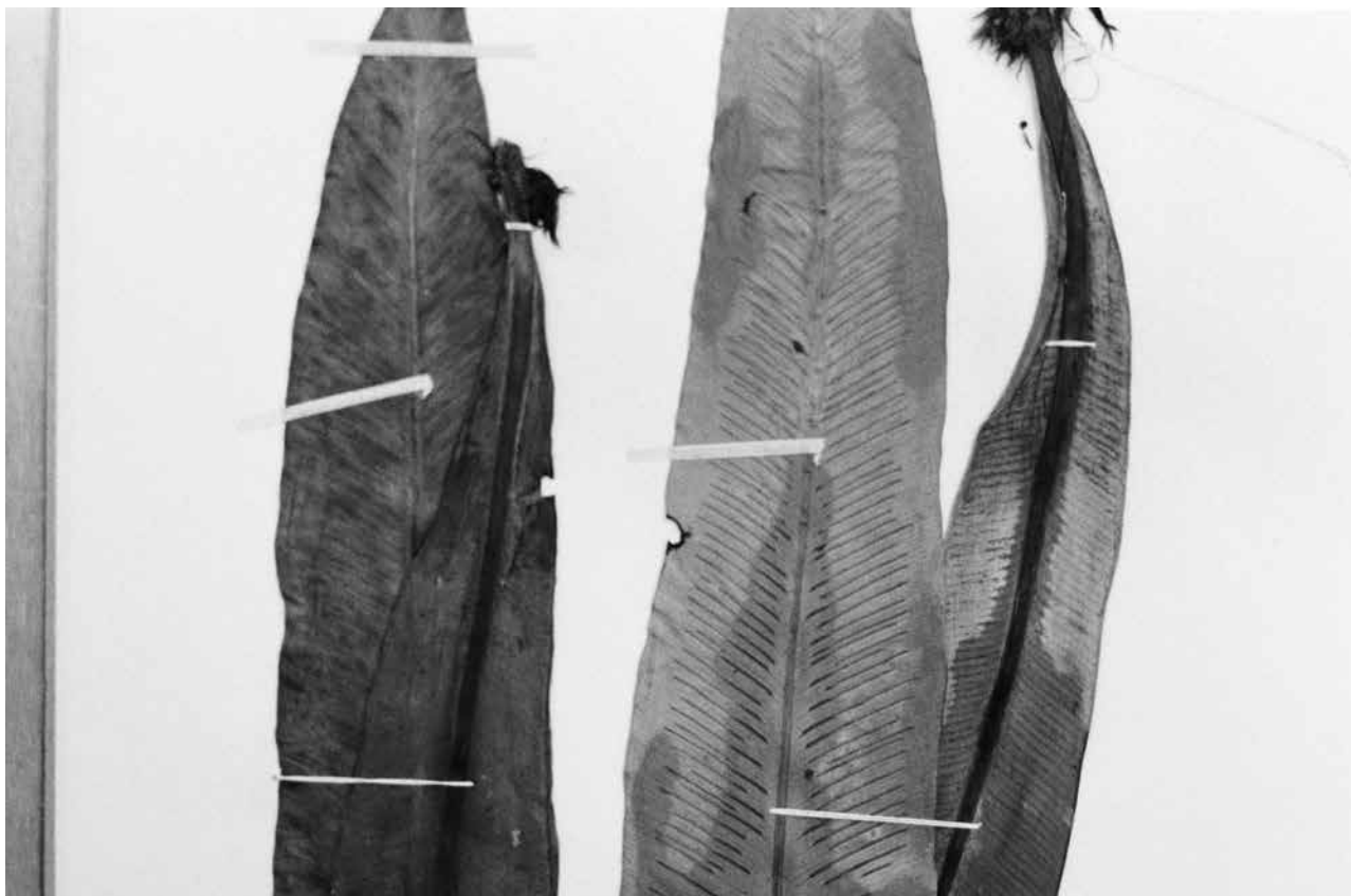
Victoire Thierrée , Codiaeum variegatum #1 , 2023, tirage gélatino-argentique