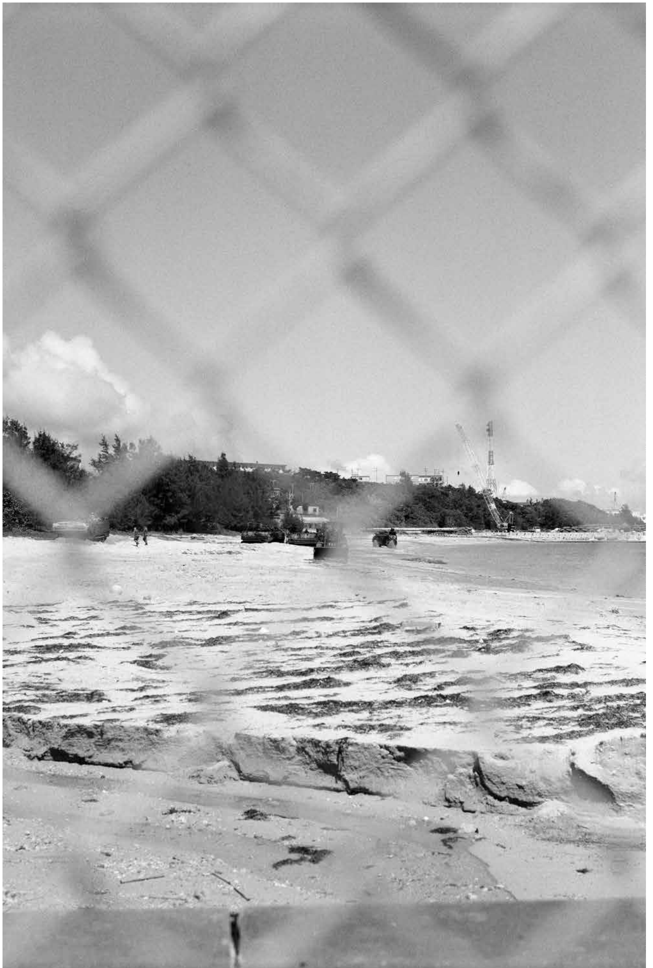
Victoire Thierrée , Henoko #6 , 2019, tirage gélatino-argentique © Victoire Thierrée / Adagp 2025