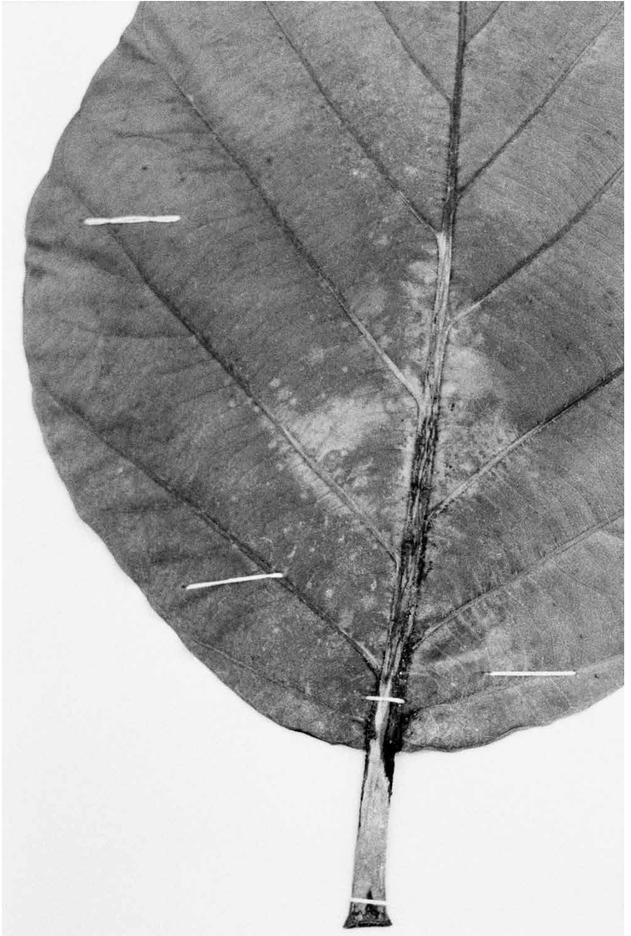
Victoire Thierrée, Artocarpus altilis #2, 2023, tirage gélatino-argentique