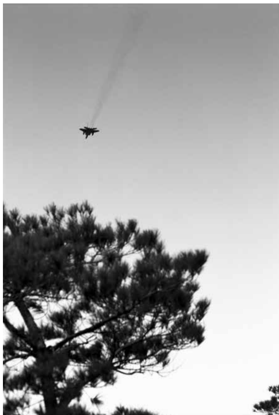
Victoire Thierrée , Kadena #2 , 2019, tirage gélatino-argentique