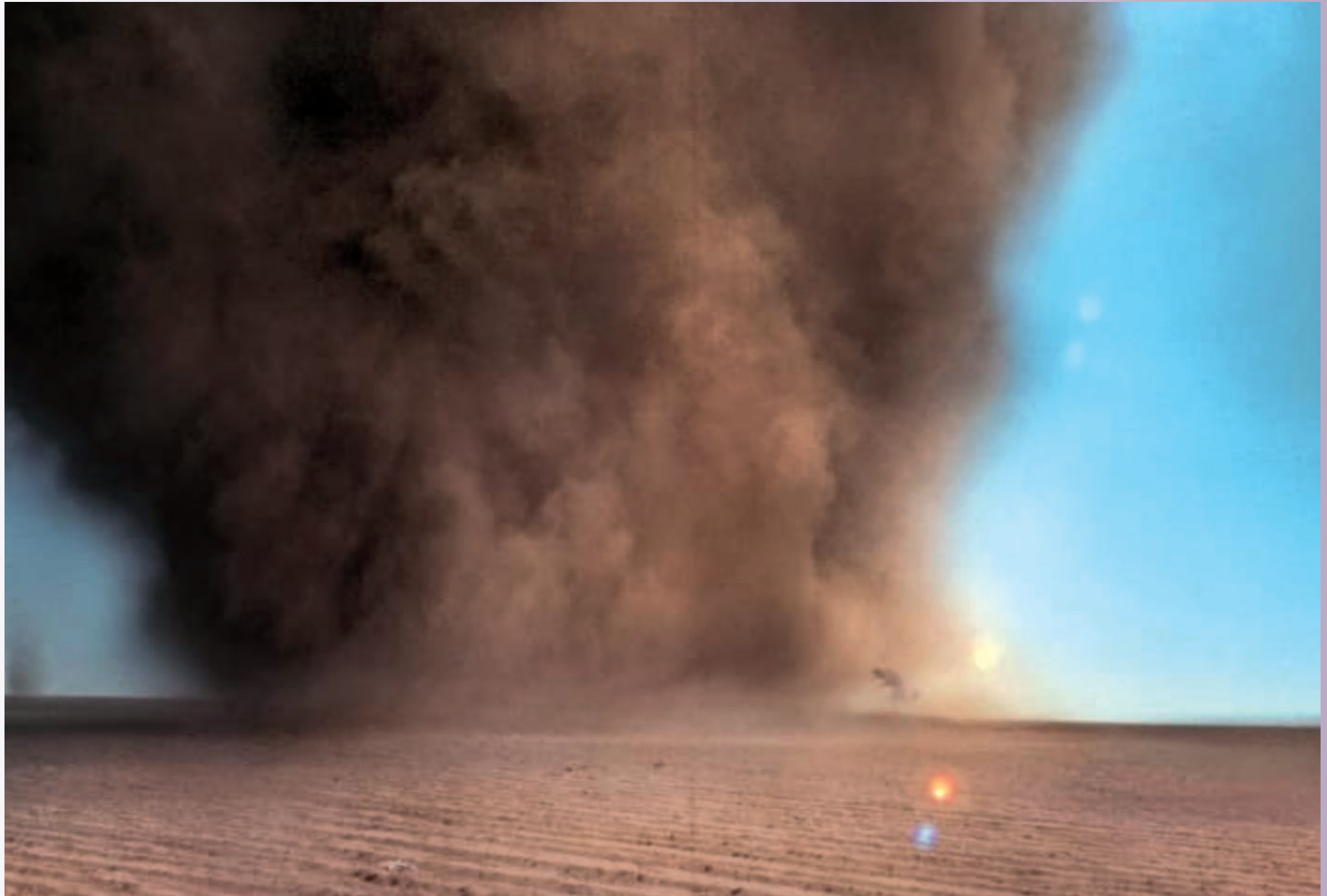
Francis Alÿs, Tornado, Mexico City (Milpa Alta), Mexico, 2010