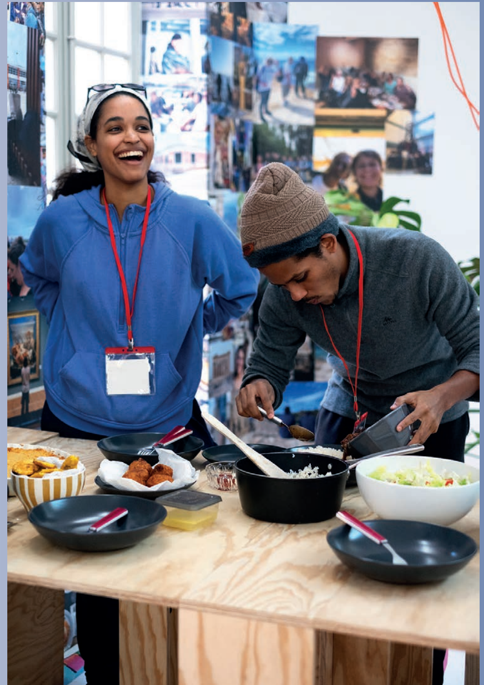
Étudiants cuisinant dans l'espace À Samedi !

Cet espace est également ouvert aux scolaires, offrant aux élèves, accompagnés d'une médiatrice, un cadre vivant pour découvrir, échanger et créer et cuisiner ensemble.