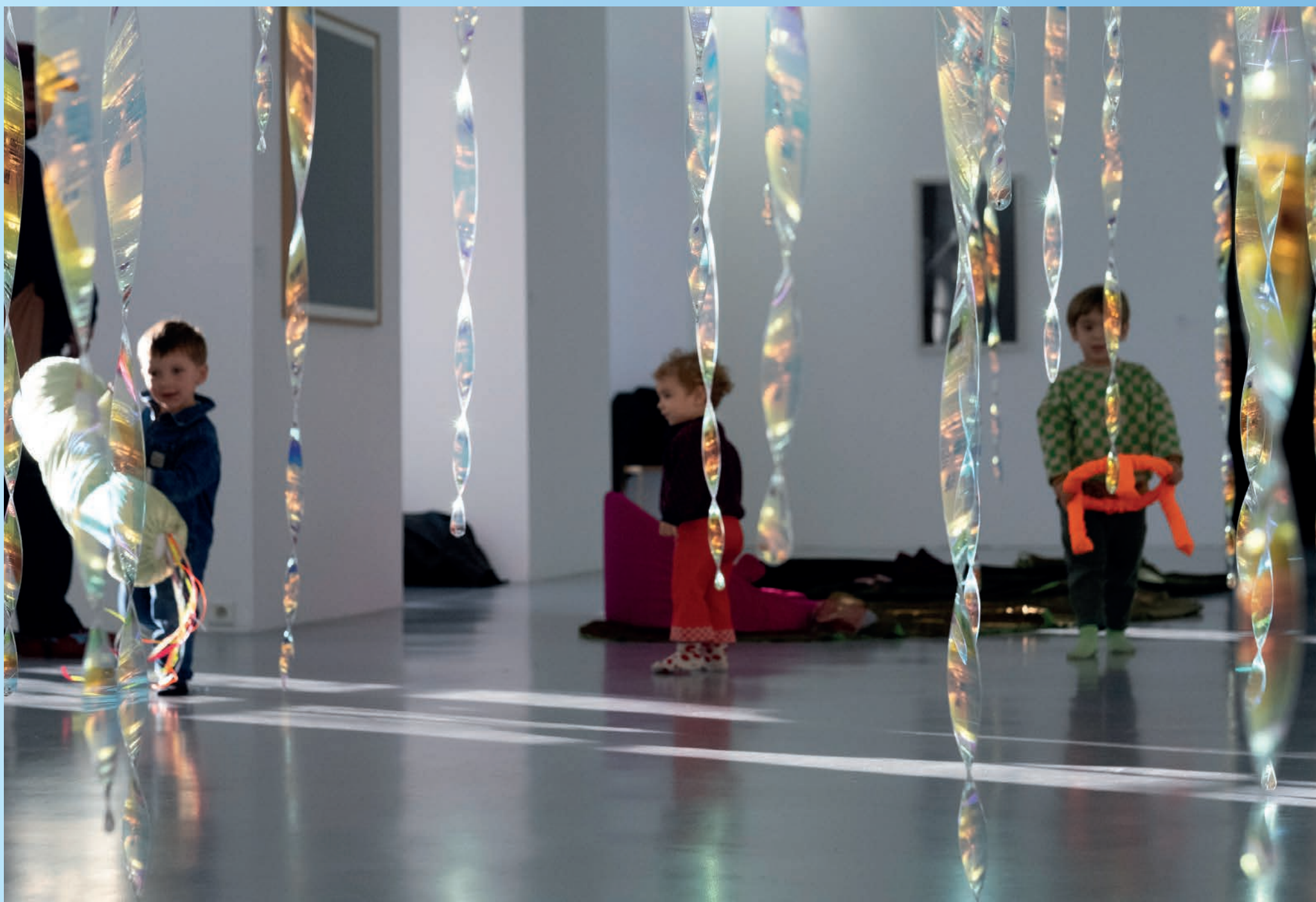
Enfants dans le dispositif FLA-C ! de l'artiste Fabienne Guilbert Burgoa au cœur de l'installation Heaven (2010) de Miroslaw Balka