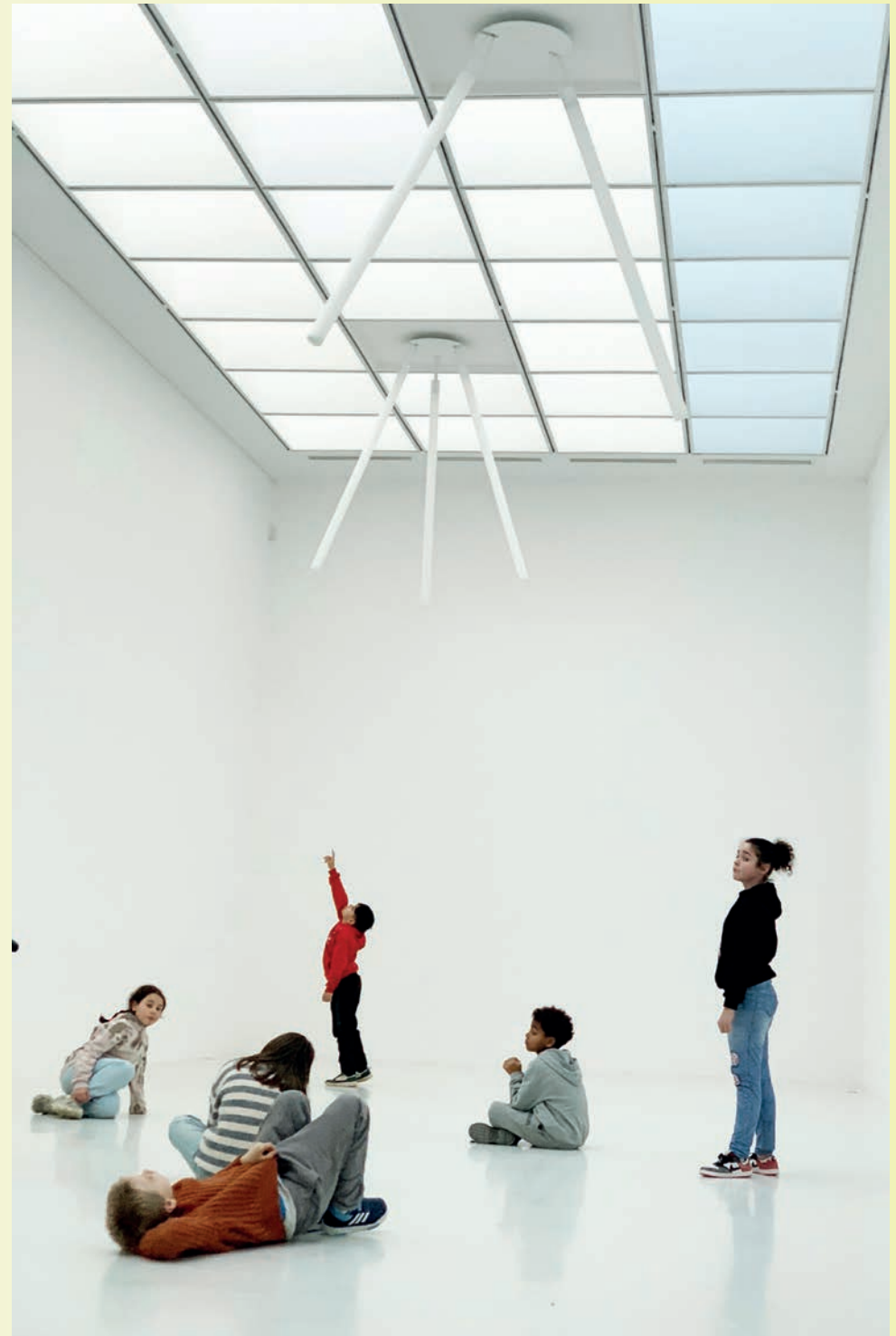
Groupe d'élèves dans l'installation de Susanna Fritscher, Flügel Klängen , 2015