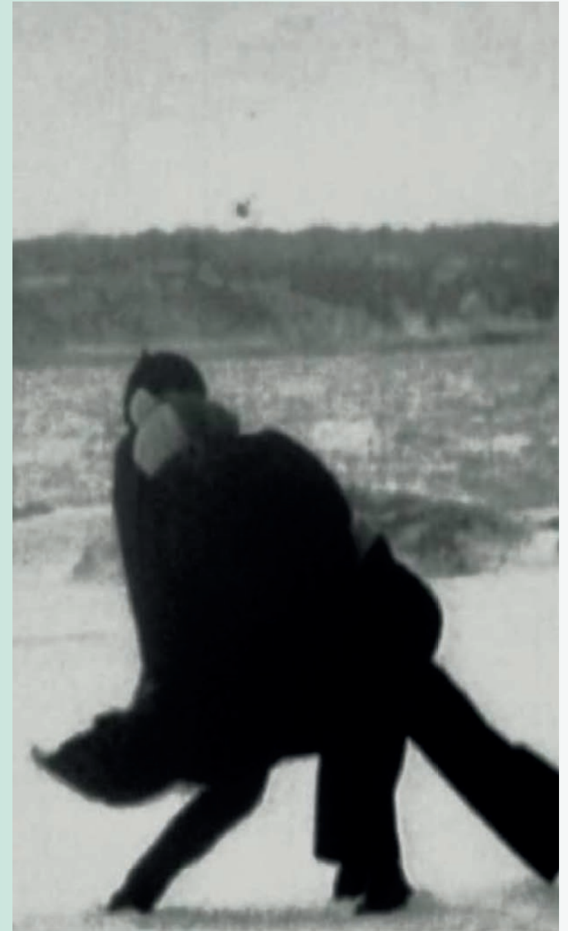
Joan Jonas, Wind , 1968