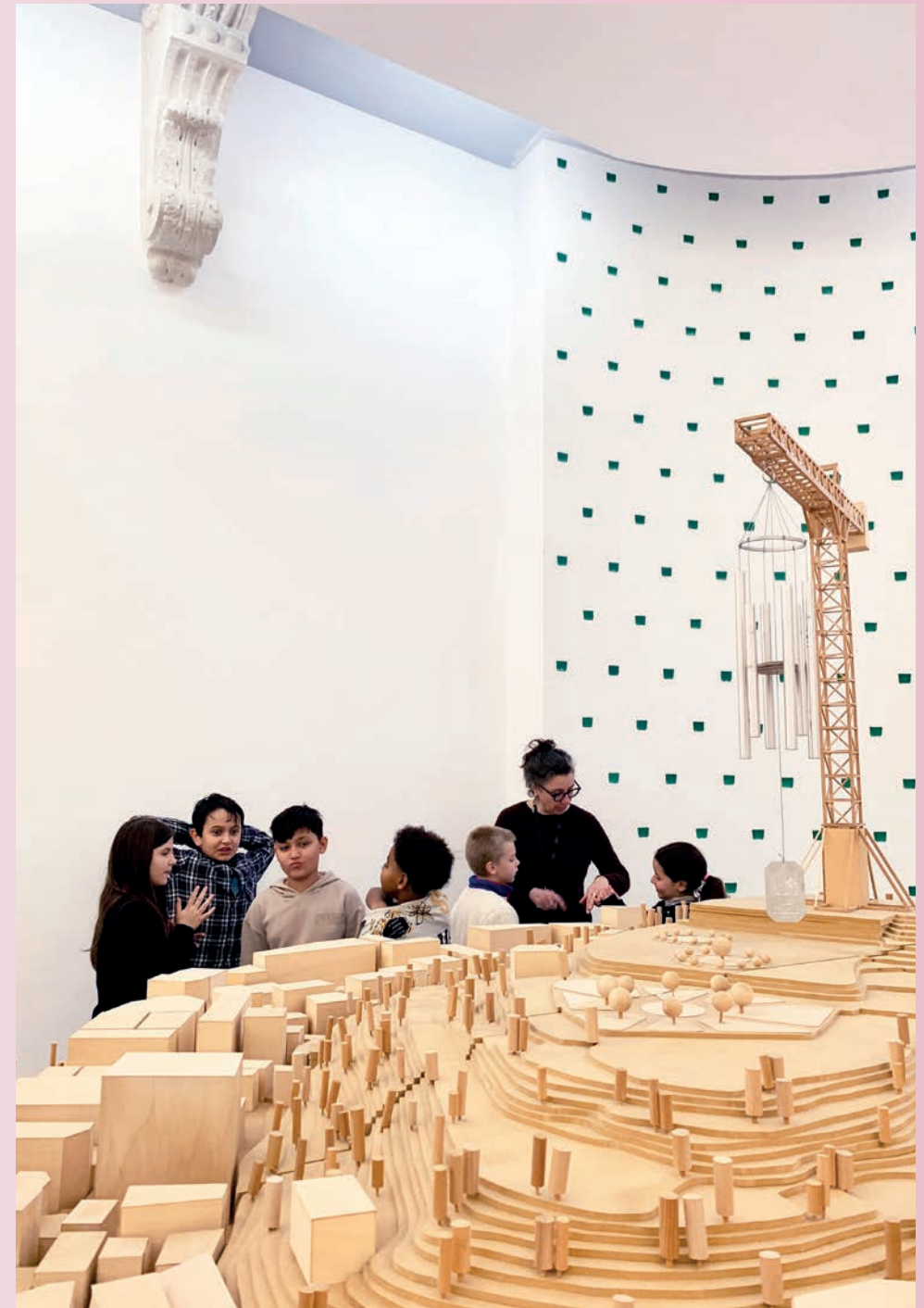
Groupe d'élèves devant l'œuvre de Mircea Cantor, Monument for the end of the world , 2006,