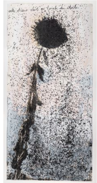
Anselm Kiefer, Cette obscure clarté qui tombe des étoiles , 1996

La phrase extraite du Cid de Corneille, qui donne son nom à l'œuvre, est un oxymore qui s'accorde avec l'impression donnée par le tableau . Les graines extraites de la terre s'envolent ici pour composer les étoiles d'un ciel presque menaçant. Se dégage de l'œuvre une impression de mystère .