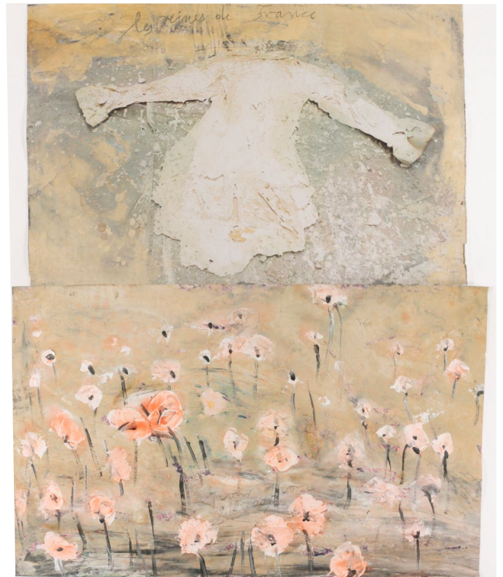
Anselm Kiefer, Les Reines de France , 2001, Collection privée Paris / dépôt à la Collection Lambert Avignon c Anselm Kiefer

«Les œuvres sur papier ont toutes pour moi une histoire que je partage avec Anselm comme la passion pour les grands mythes des origines, sa découverte de l'histoire de mon pays à travers l'arbre généalogique des Reines de France, son érudition pour l'opéra allemand, la littérature et la constitution de la langue française qu'il connaît parfaitement désormais.[...]»