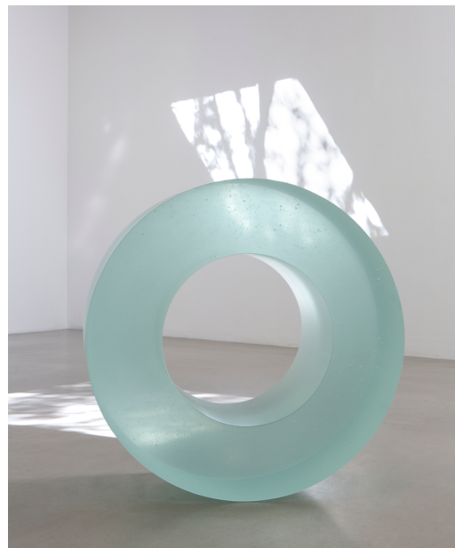
Ann Veronica Janssens, Blue glass roll 405/2 , 2019

Comme beaucoup de ses œuvres, Blue glass roll 405/2 est faite d'un matériau simple directement posé au sol mais travaillé avec beaucoup de savoir-faire que l'artiste n'hésite pas à aller chercher à l'étranger, là où il est .