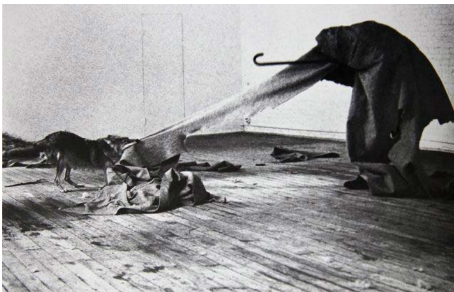
Joseph Beuys, I like America and America likes Me , 1974

Artiste prolifique, Joseph Beuys est une figure incontournable de l'art contemporain, qui a construit son propre mythe . Il raconte ainsi qu'alors qu'il est engagé dans l'aviation allemande, son avion est abattu en Crimée. Sauvé par les Tatars, il est déshabillé, enduit de graisse et enroulé dans du feutre, selon une méthode curative ancestrale. Cette expérience, réelle ou fantasmée, est la base de la mythologie de Beuys — qui utilise à de multiples reprises dans ses œuvres du feutre, de la graisse ou de la cire. Ces matériaux représentent pour lui le combat de l'humanité pour sa survie .