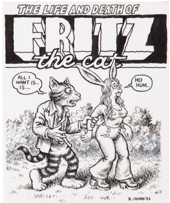
Robert Crumb, The Life and Death of Fritz the Cat , 1993

Se renouvelant tout au long de sa carrière, notamment d'un point de vue stylistique, Robert Crumb continue jusqu'à aujourd'hui de porter un regard acerbe sur le monde contemporain. Ses nombreuses œuvres sont incontournables dans l'histoire du comics et de la bande-dessinée.