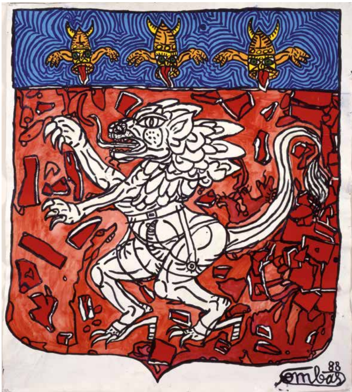
Robert Combas Sans Titre , 1988

Donation Yvon Lambert à l'État français / Centre national des arts plastiques / Dépôt à la Collection Lambert, Avignon © Adagp, Paris, 2021