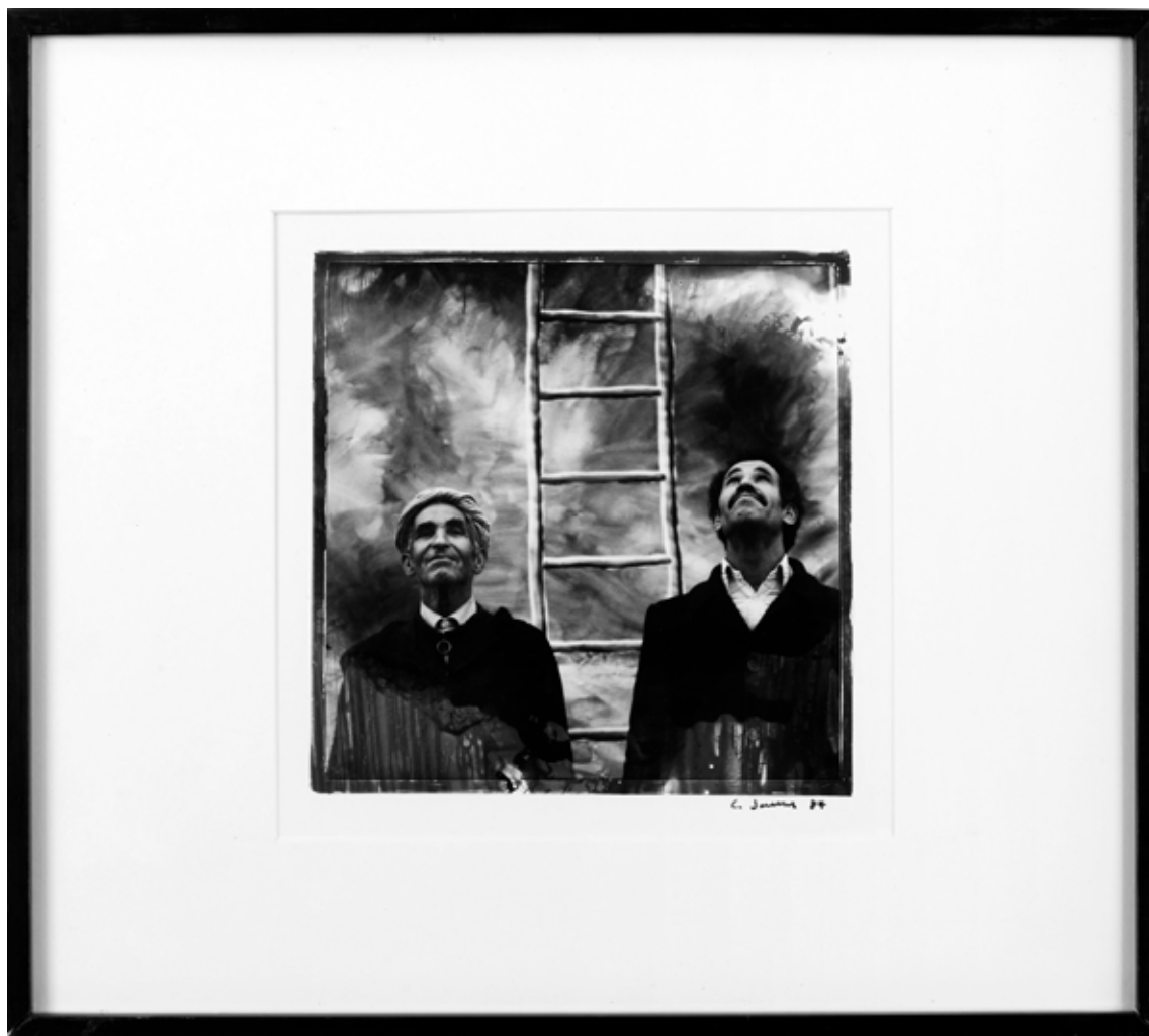
Louis Jammes Sans titre , 1988 Collection privée, Paris / Dépôt à la Collection Lambert, Avignon