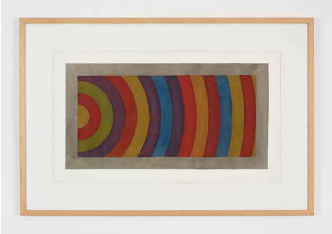
Sol LeWitt Arcs from the Midpoint of the Left Side , 1988 Collection privée, Paris / Dépôt à la Collection Lambert, Avignon © Adagp, Paris, 2021