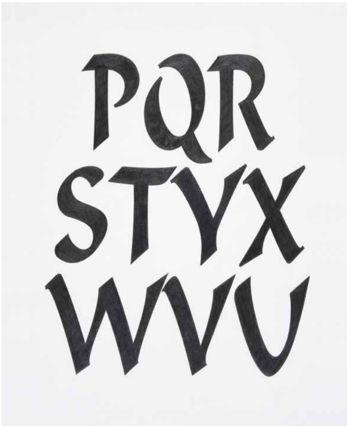
Kay Rosen The River , 1988 Collection privée, Paris / Dépôt à la Collection Lambert, Avignon © Kay Rosen