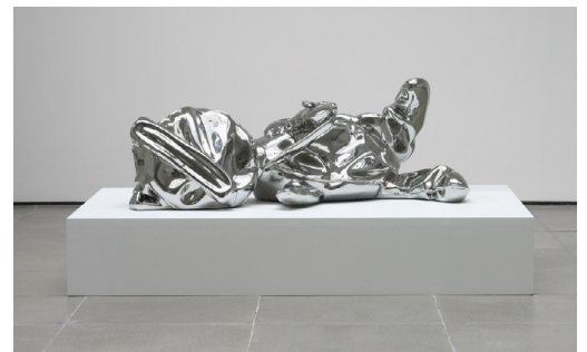
Deflated Sculpture III, 2009

Dans un geste qui emprunte davantage à la parodie qu'à la simple copie, Jonathan Monk questionne nos rapports à l'originalité de l'œuvre et à l'aura de l'artiste issue de la modernité. En filigrane, c'est tout le système de l'art et son marché que l'artiste tourne à la dérision, non sans une affection particulière pour ce monde dans lequel il navigue tel une sorte de dandy postmoderne.