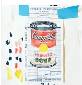
Restaurant Drawings d'après Andy Warhol, 2016

Admirateur des artistes tels que Marcel Duchamp , Donald Judd , Andy Warhol ou encore Sol LeWitt , il se réfère aux œuvres de ses artistes pairs en les détournant de façon ironique . Il s'amuse à reprendre le nom de Donald Judd sur deux gobelets lorsqu'il commande un café à Starbucks, il attend des stars avec une pancarte à leur nom dans les halls de gares ou les aéroports, donne des rendez-vous à la Tour Eiffel aux collectionneurs ayant acheté son enveloppe contenant l'invitation, il dégonfle symboliquement les sculptures emblématiques de Jeff Koons ou reproduit les œuvres de ses idoles sur des notes de restaurant pour questionner le marché de l'art.