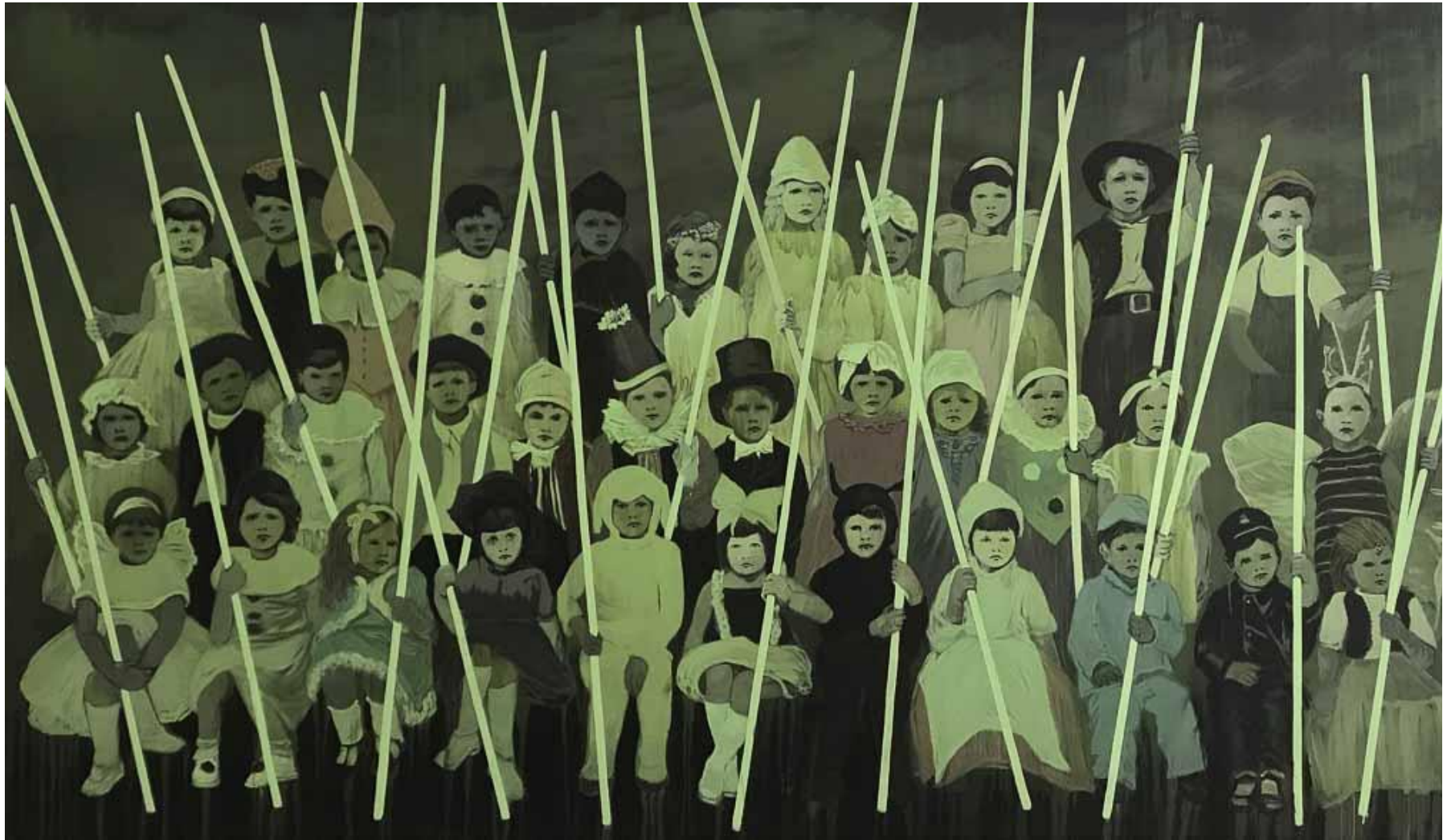
Les Veilleurs - 2014