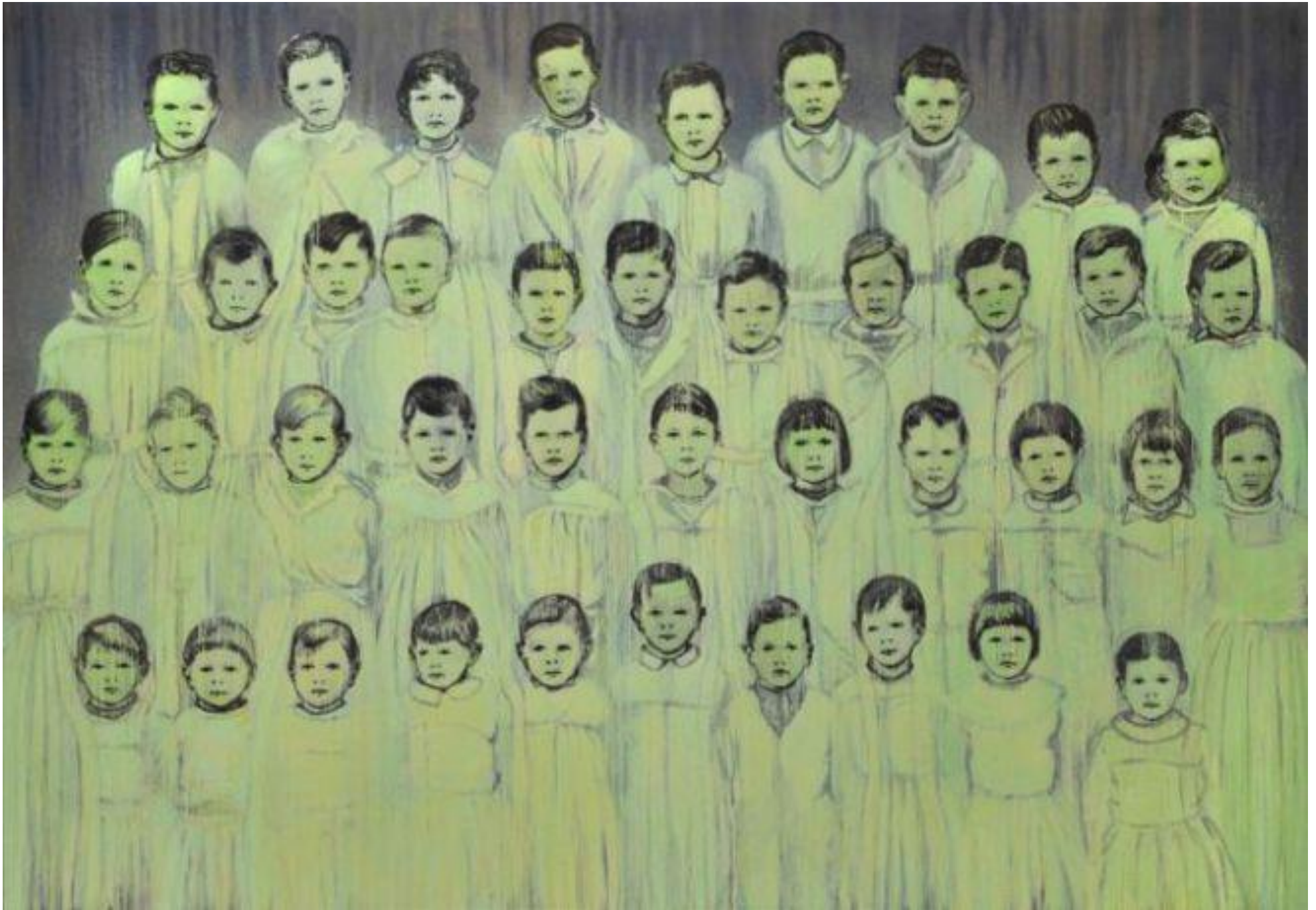
Grande Camisole- 2014