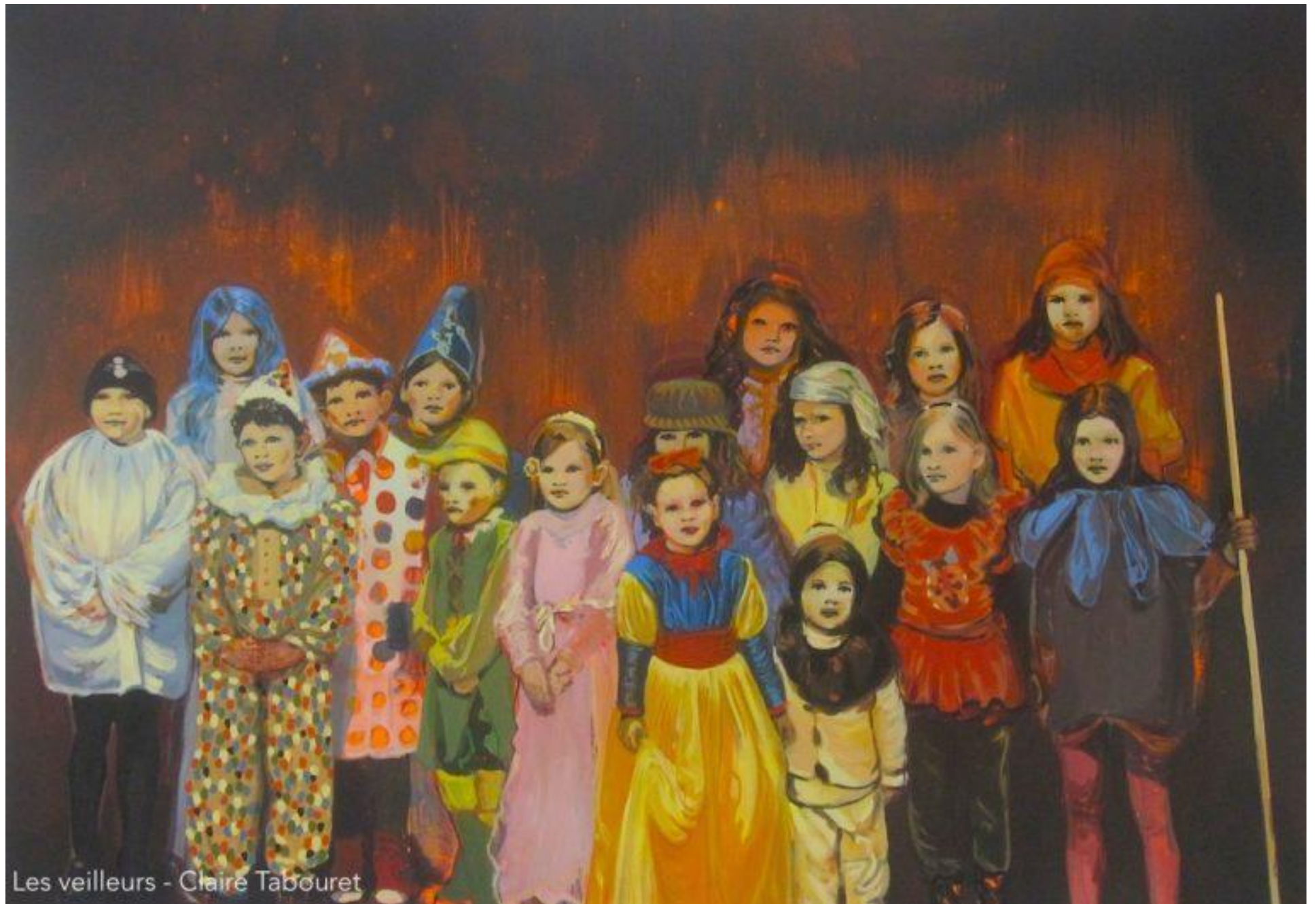
Les veilleurs - Claire Tabouret